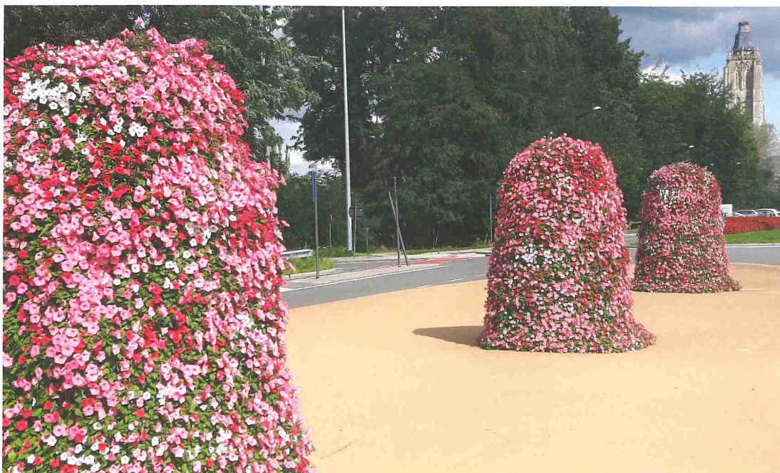
Bloementorens in de Minderbroedersstraat ter hoogte van de aankomstlijn van de Ronde van Vlaanderen