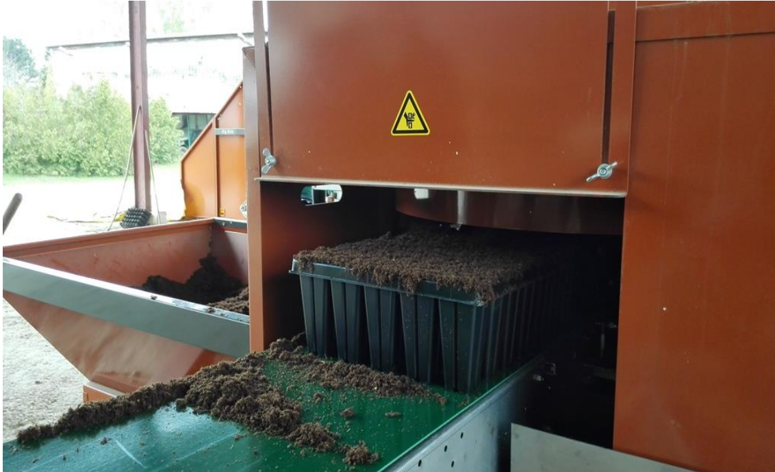
26.4.2017 Semilleros sembrados con TerraCottem® Universal recientemente colocadas en los invernaderos